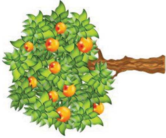
на яблоне растут